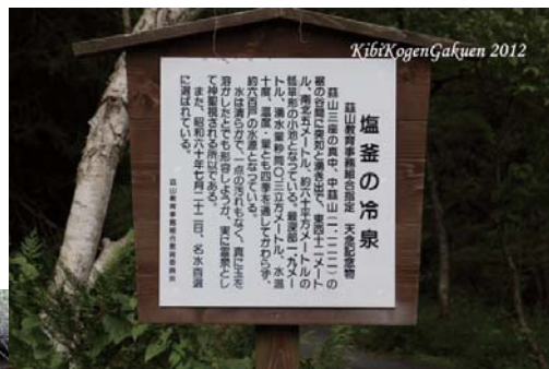
⑯ 下山したら、冷泉の美味しく冷たい水で……疲れが癒されます。