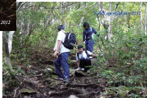
⑬ 下山は足下に気をつけないと、滑って転んで、泥まみれ。