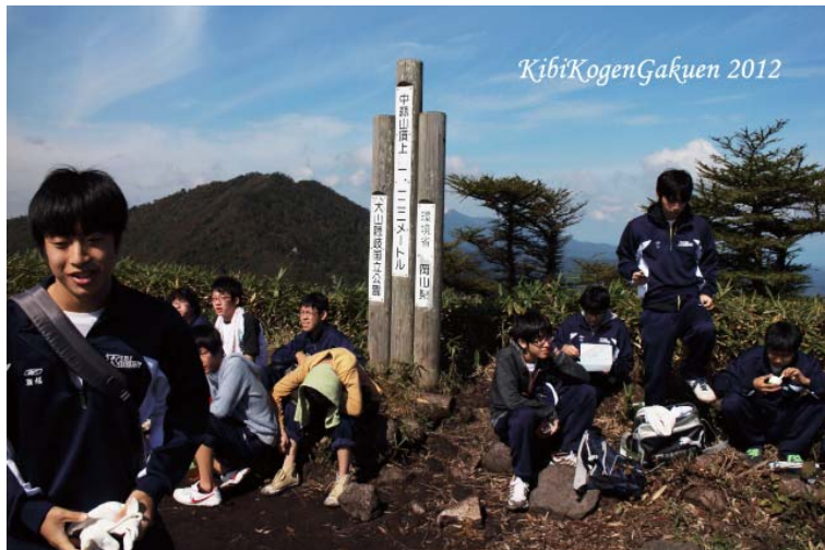
⑪ 頂上にて、『下界』を眺めながら、美味しい弁当をいただきました。