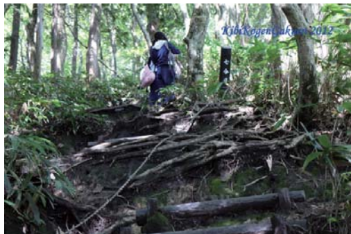
⑥ 休憩をとりながら登っていきます。