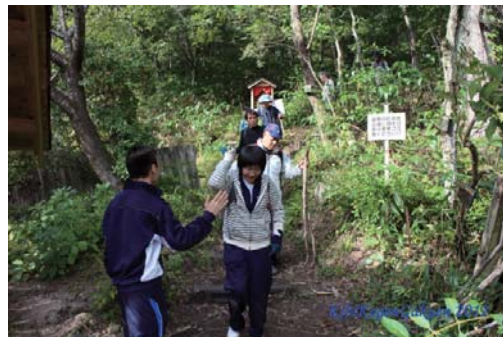
⑮ 無事下山。……みんな、助け合って下りてきました。