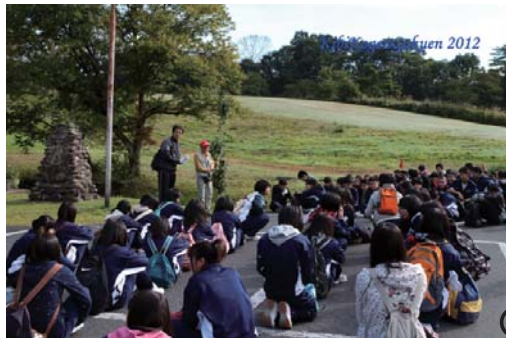
① ガイドの方の話の後、弁当を受け取り、出発。