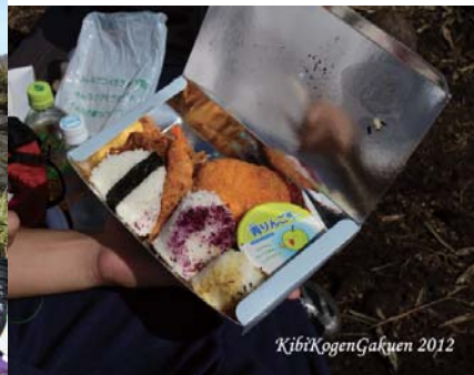
⑩ 美味しい弁当、ごちそうさまでした。