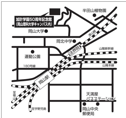
岡山市会場 (県外生・1期・2期入試)