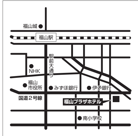
福山市会場（1期入試）