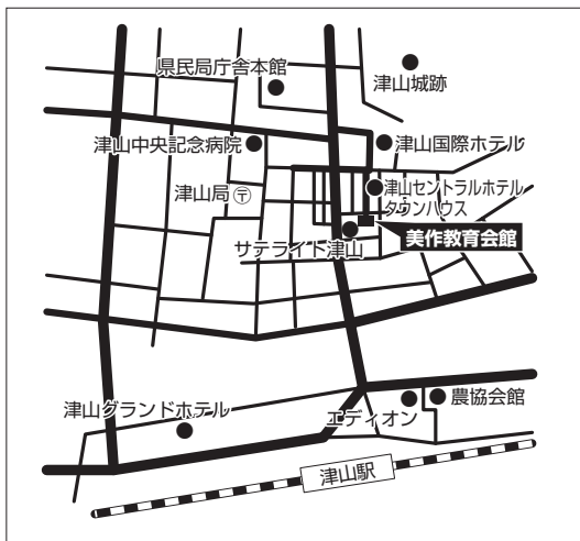
津山市会場 (県外生・1期入試)