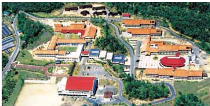
素晴らしい出会い。生徒と先生が生活を共にする快適な寮生活。